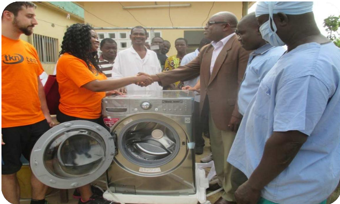
Remise de la machine aux autorités locales

C'est dans cette optique que L'ONG Fi Bassar a fait don au Centre Hospitalier Préfectoral de Bassar une machine à laver industrielle.