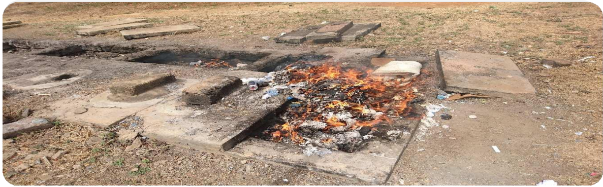
Avant: Longue combustion des déchets infectieux à forte émission