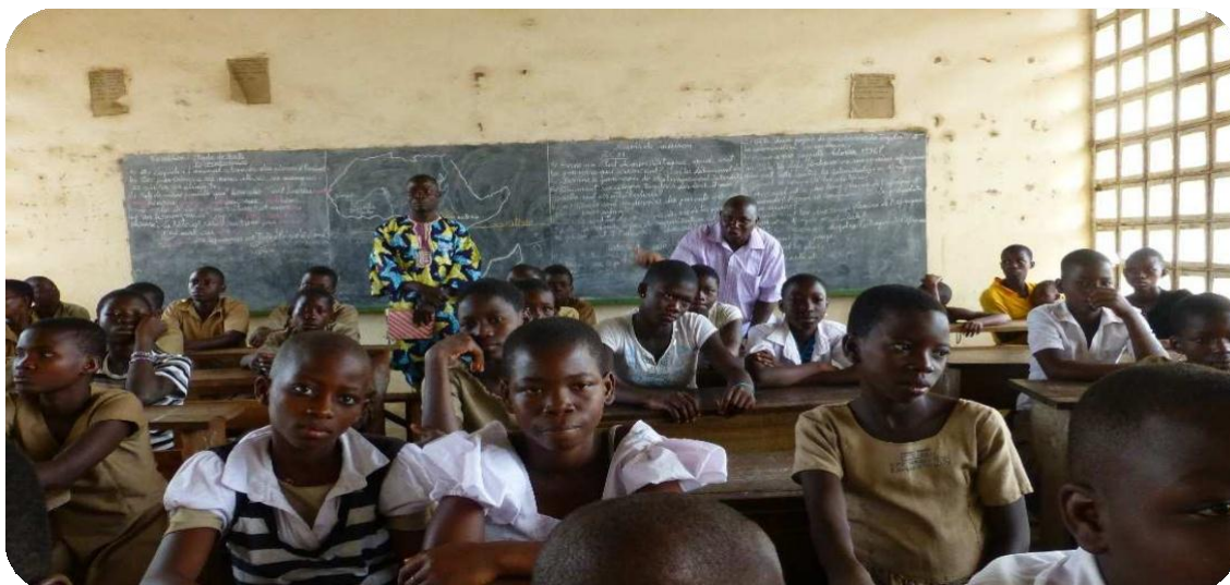
Sensibilisation aux élèves