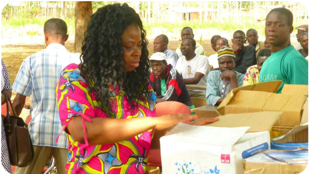
Relise des kits scolaires aux responsables de l'école