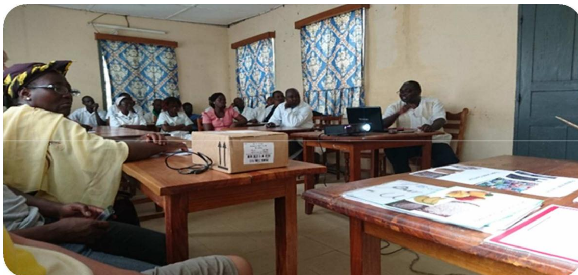
Formation du personnel du CHP de Bassar