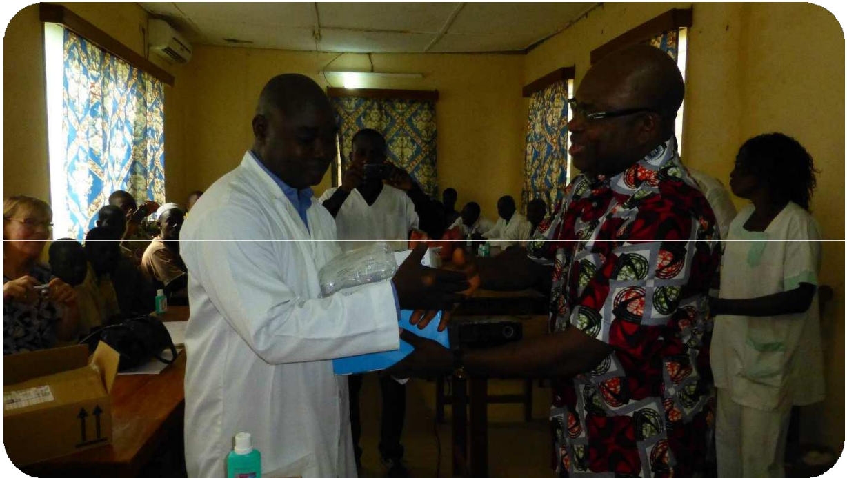
Transmission du don par le préfet de Bassar aux responsables de CHP

H. Prise en charge des frais d'apprentissage de deux jeunes filles En 2016, pour le compte de ses activités, l'ONG a enregistré la prise en charge des frais d'apprentissage de deux jeunes filles (une couturière et une coiffeuse) pour une valeur de 150 euro chacune soit F CFA 196 787.