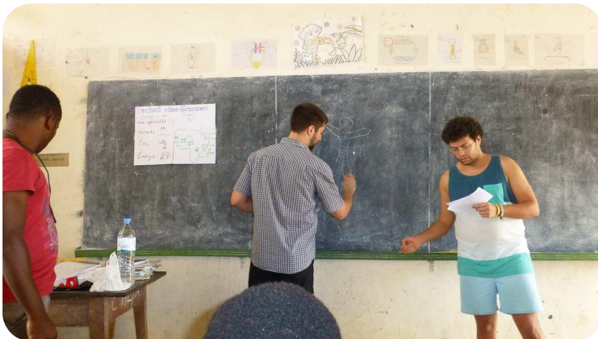
Sensibilisation aux élèves

La mauvaise gestion des ordures ménagères trouve son origine non seulement dans l'absence des poubelles et décharges publiques mais aussi dans des comportements irresponsables des élèves. C'est dans ce cadre que l'ONG Fi Bassar en collaboration avec ses partenaires a sensibilisé les élèves de l'école de Bikotiba sur le problème des ordures. Afin de les mettre en pratique, l'ONG a fait don des poubelles à l'école.