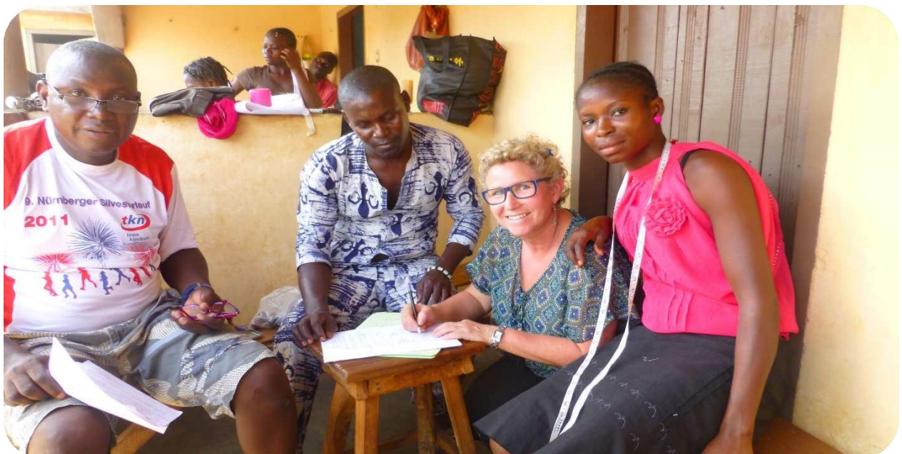
Signature du contrat de la Couturière

H. Prise en charge des frais d'apprentissage de deux jeunes filles En 2016, pour le compte de ses activités, l'ONG a enregistré la prise en charge des frais d'apprentissage de deux jeunes filles (une couturière et une coiffeuse) pour une valeur de 150 euro chacune soit F CFA 196 787.