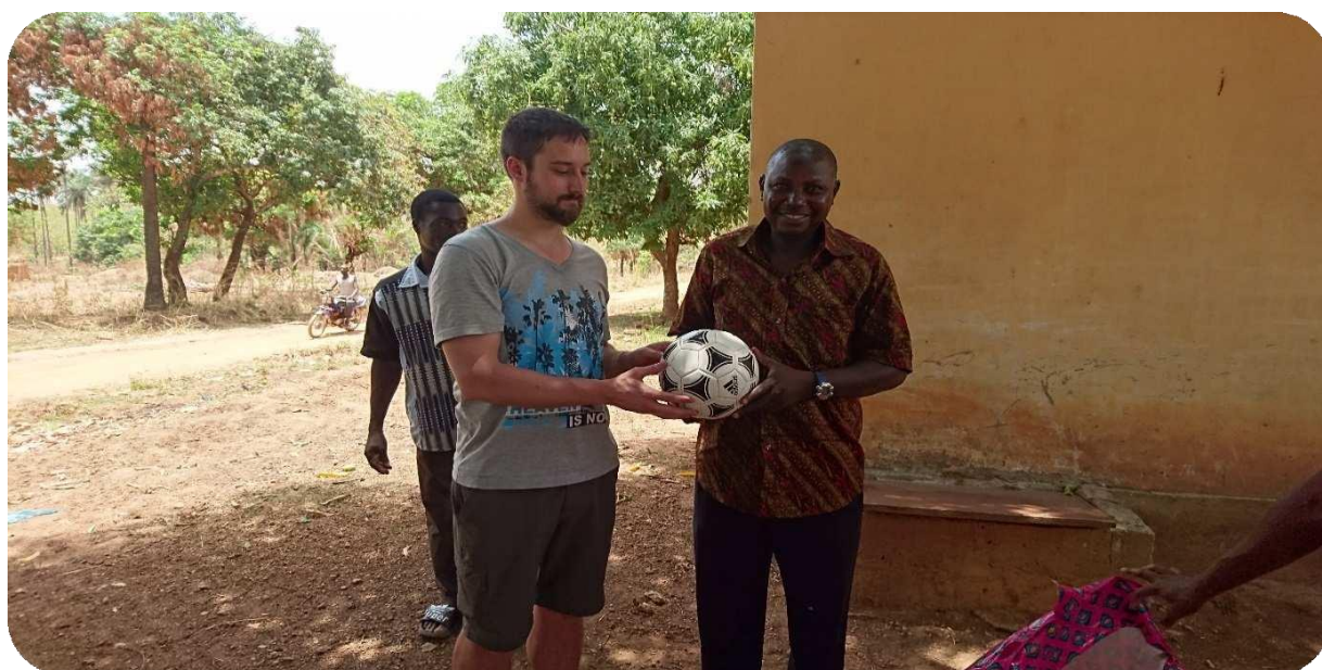
Remise de l'équipement de sport

L'ONG Fi Bassar poursuit sa mission, celle de promouvoir le football togolais à la base, de fournir des matériels sportifs aux élèves. Ainsi, courant l'année 2016 elle a remis de matériel sportif (Maillots et ballons) aux élèves de Bassar et de Kabou pour une valeur de 8 000 euros soit 5 247 656 F CFA.